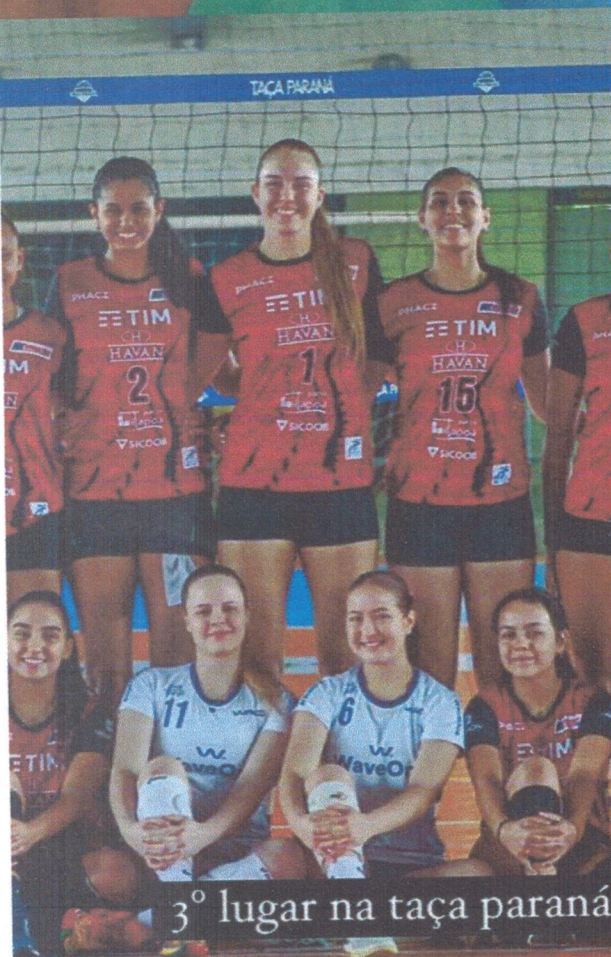
3º lugar na taça paraná em são josé dos pinhais