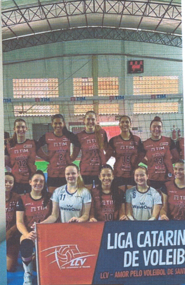
campeã da liga catarinense + atleta destaque no ginásio inácio gullini