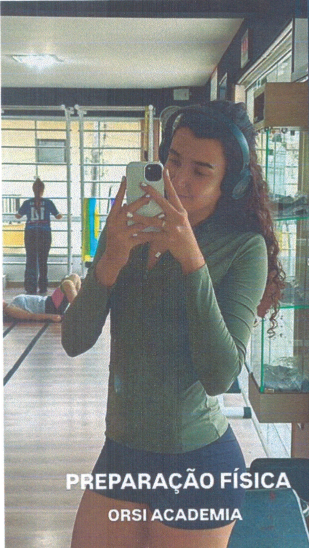
PREPARAÇÃO FÍSICA ORSI ACADEMIA