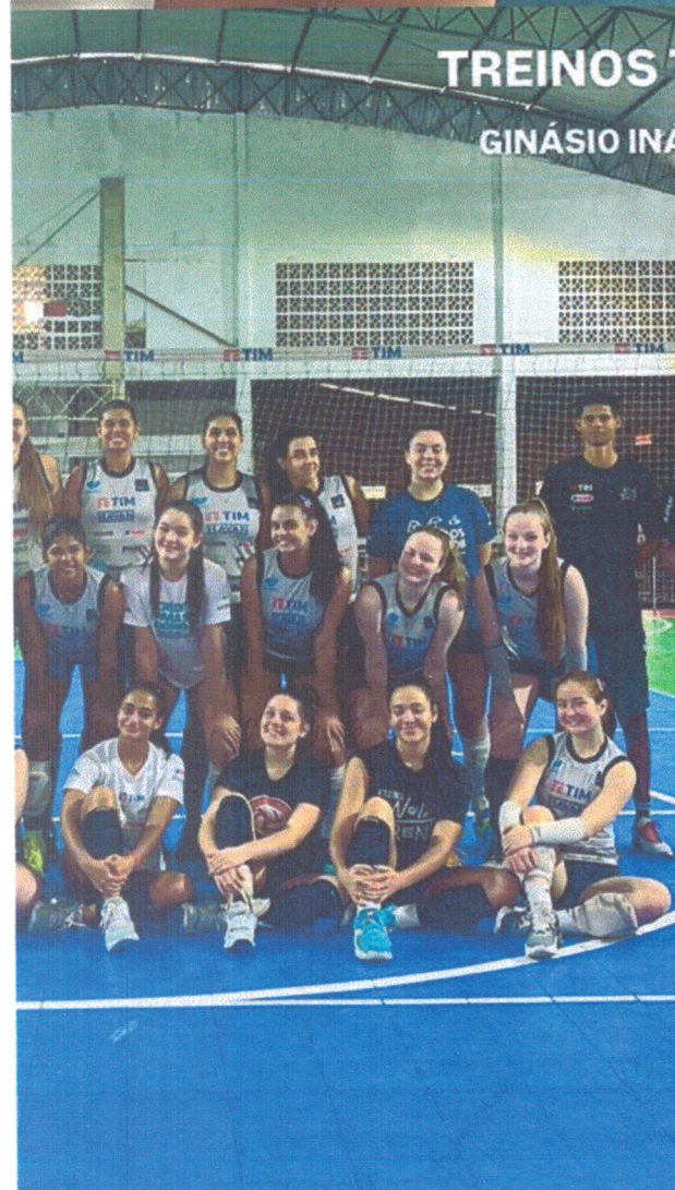
TREINOS TÉCNICOS GINÁSIO INÁCIO GULLINI