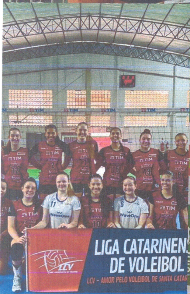
liga catarinense sub19