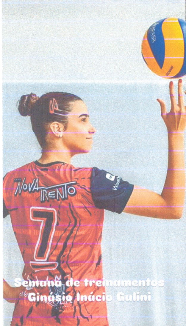
Semana de treinamentos Ginásio Inácio Gulini