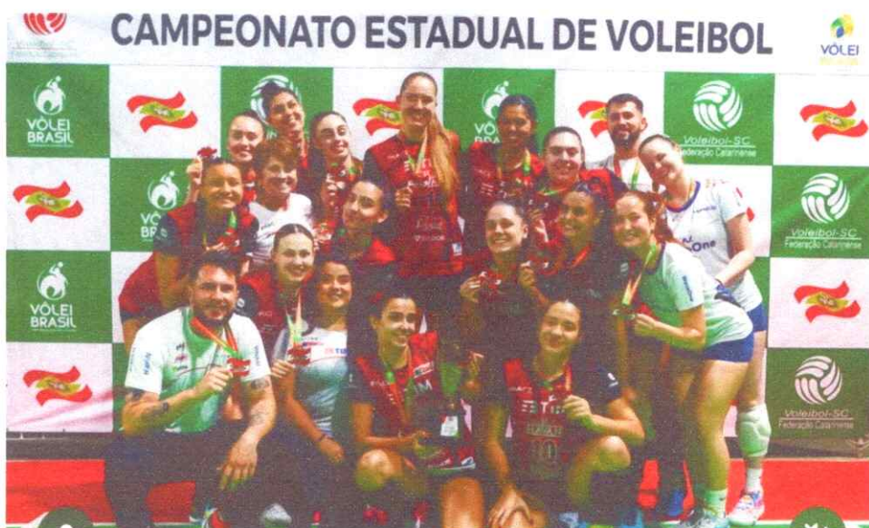
Imagem : Estadual Sub-21