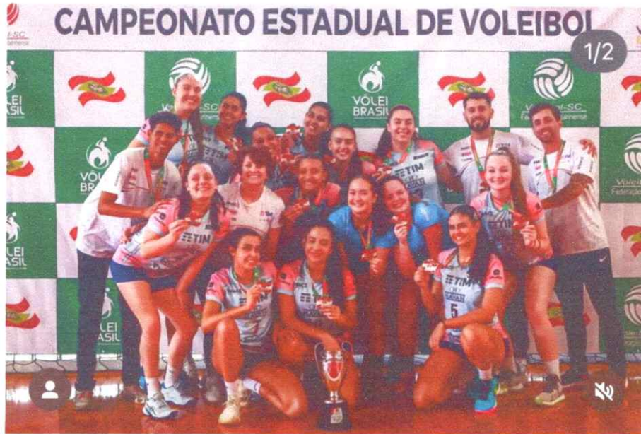
Imagem: Final Ouro Sub-19