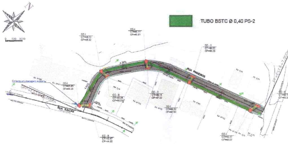
Imagem 1 – Projeto de drenagem