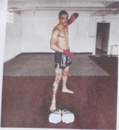
.Preparação pro campeonato.