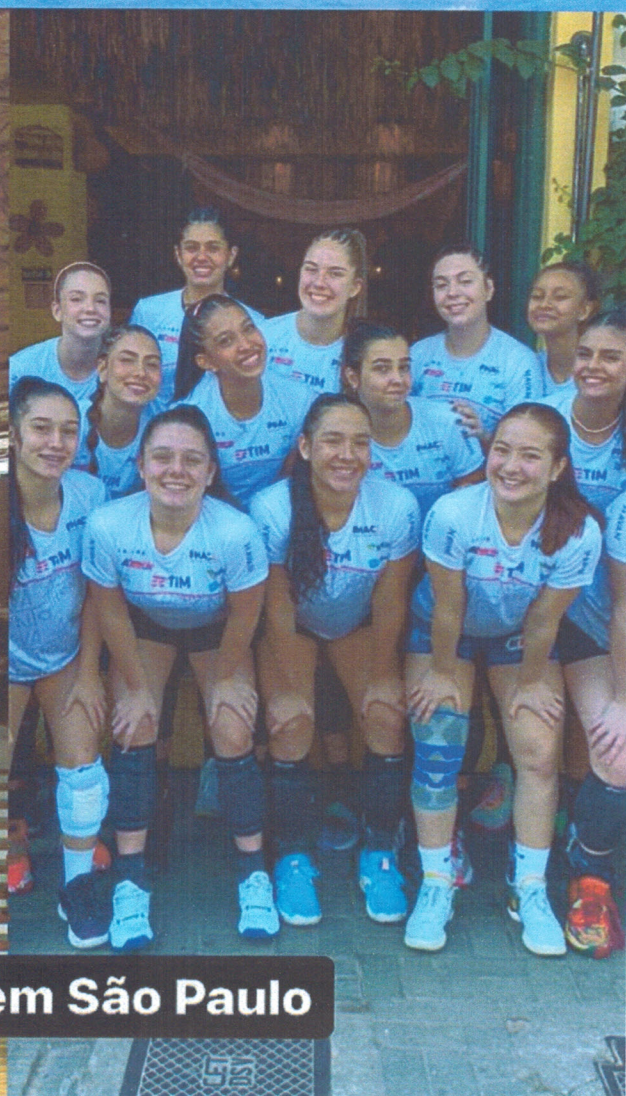
cbi sub-19 em São Paulo