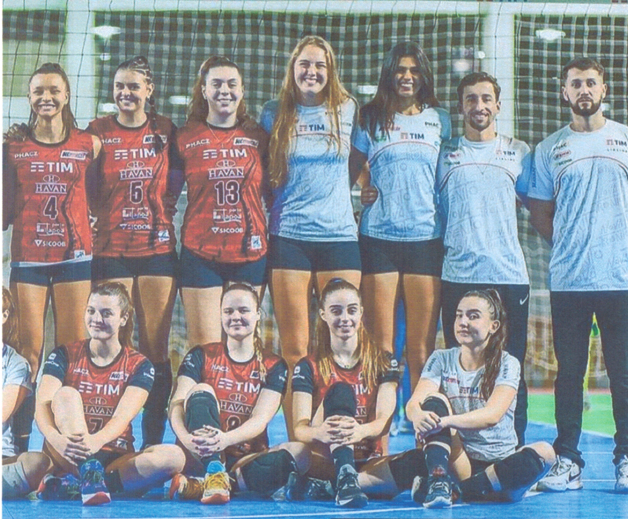
estadual sub-19 em Nova Trento