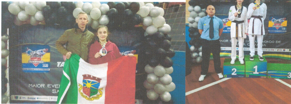
Figura 12º LUGAR mega open

Neste mês participei do Campeonato catarinense de taekwondo, realizado pela FCTKD na cidade de Blumenau entre os dias 14 e 16 de junho, me tornando campeão catarinense na categoria juvenil e do mega Open na cidade de Itajaí.