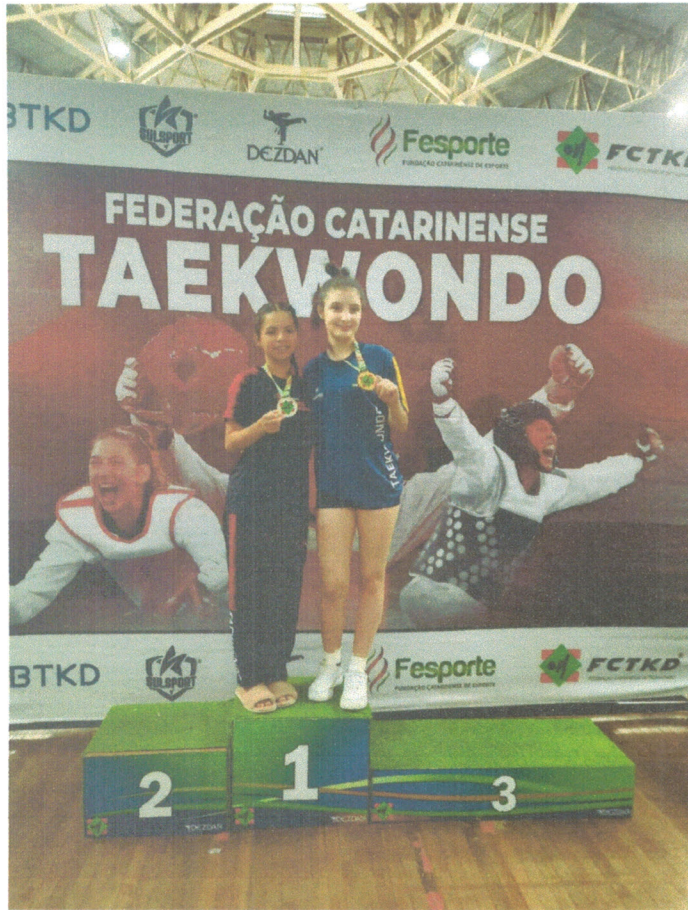
Figura 21º lugar catarinense