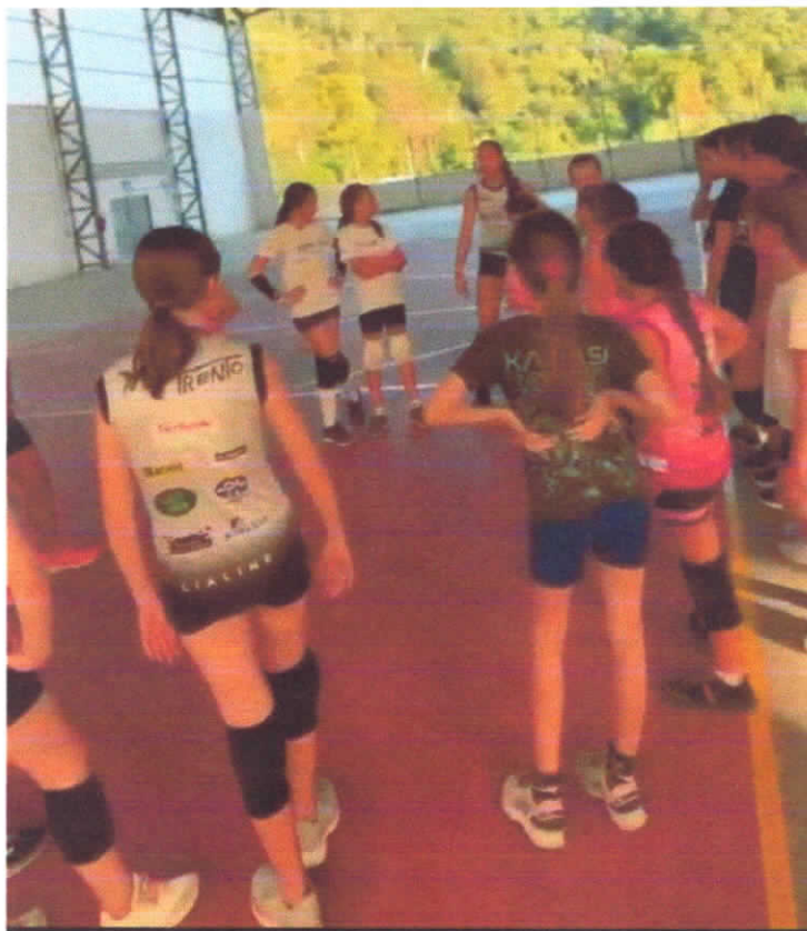
04/03/2024 –Escolinha no período vespertino.

CNPJ:04.991.606/0001-97 RuadosImigrantes, 350, Centro - CEP-88270-000 Nova Trento – Santa Catarina FUNDAÇÃO:02/02/2002