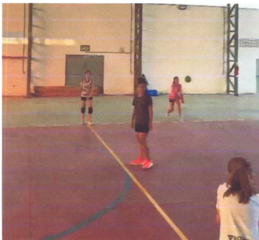
04/03/2024 – Escolinha no período vespertino (2)