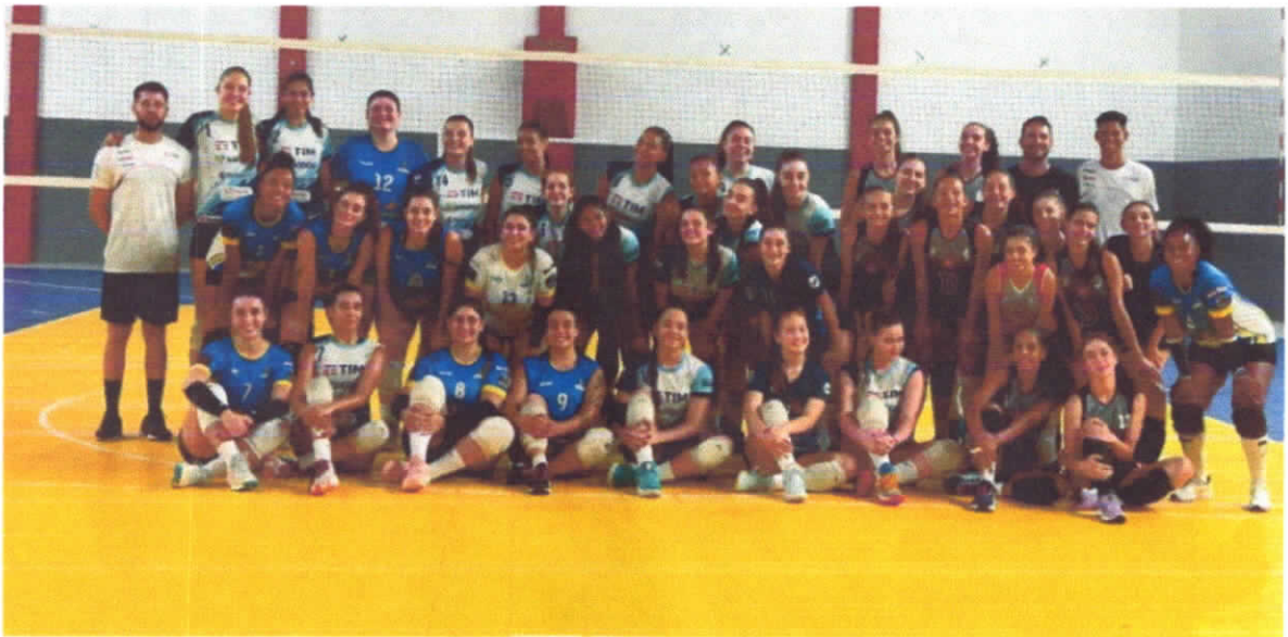
30/03/2024—Amistoso em São José (Preparatório para as competições do ano)

CNPJ:04.991.606/0001-97 RuadosImigrantes, 350, Centro - CEP-88270-000 Nova Trento – Santa Catarina FUNDAÇÃO:02/02/2002