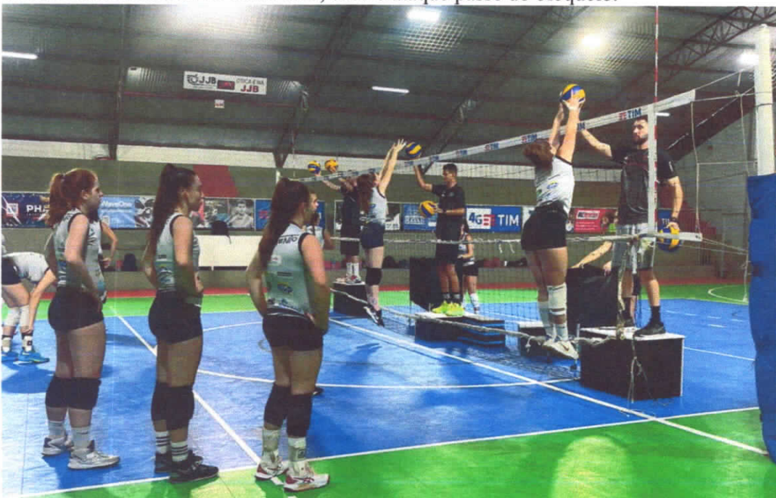
21/03/2024 -Treino de bloqueio com ajuste de mãos.

Levantadora recebe uma bola na mão e levanta para a posição 2 (saída) onde a atacante está esperando para atacar sobre a plataforma que simula o bloqueio enquanto a libero e a outra levantadora defendem do outro lado, caso o ataque passe do bloqueio.