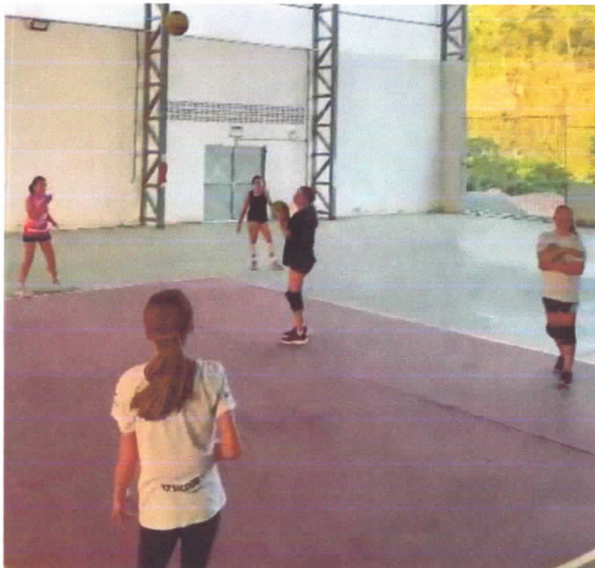
Escolinha de voleibol período vespertino

Mais de 100 alunas fazem parte do projeto de Vôlei de Nova Trento, proporcionando saúde, aptidão física, disciplina e responsabilidade.