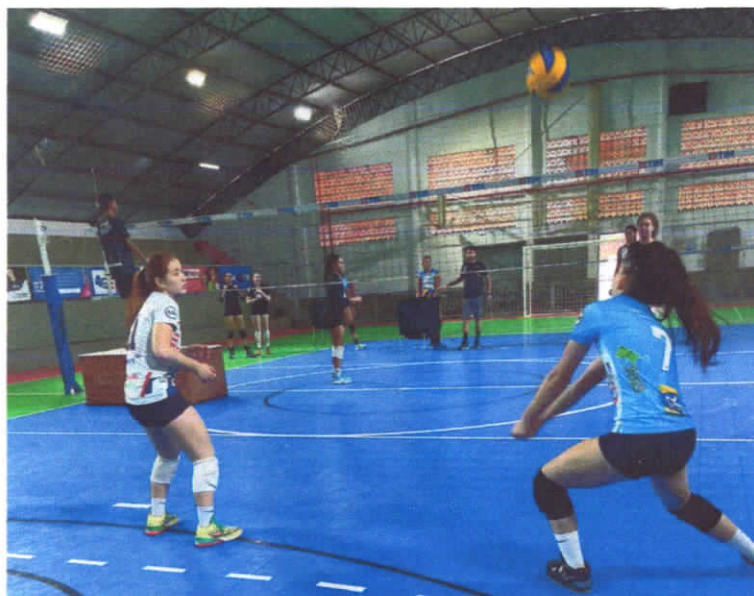
12/03/2024 -TREINO DE DEFESA

CNPJ:04.991.606/0001-97 RuadosImigrantes, 350, Centro - CEP-88270-000 Nova Trento – Santa Catarina FUNDAÇÃO:02/02/2002