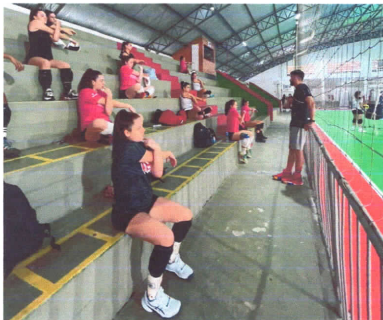
05/03/2024 – Mobilidade pré-treino

Exercícios de mobilidade é essencial para o desempenho esportivo, prevenção de lesões e recuperação, a mobilidade envolve flexibilidade, força, controle motor e coordenação. Iniciamos todos os treinos, com alongamento e mobilidade antes.