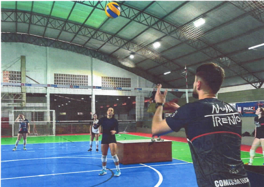
18/03/2024 –Ajuste de bola

CNPJ:04.991.606/0001-97 RuadosImigrantes, 350, Centro - CEP-88270-000 Nova Trento – Santa Catarina FUNDAÇÃO:02/02/2002