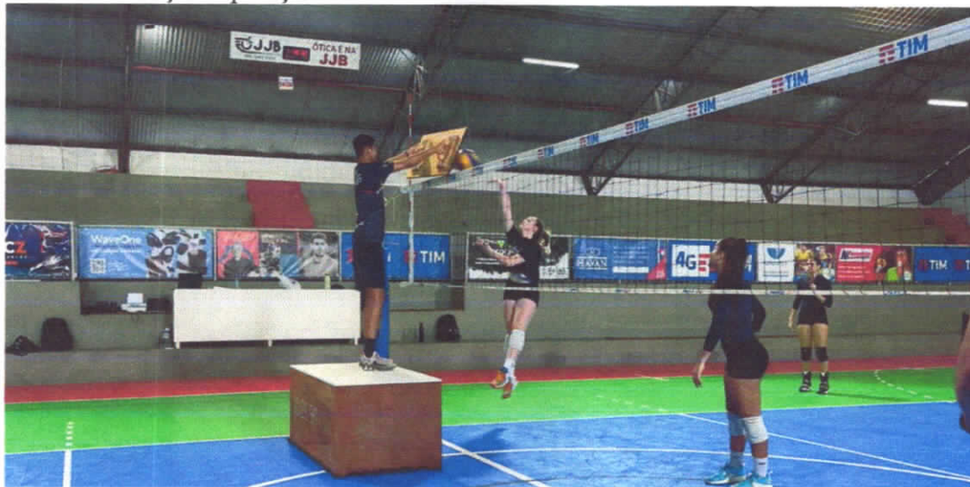
18/03/2024 –Treino de ataque com bloqueio subsequente.

Nesse treinamento colocamos as meninas de um lado atacando e a líbero e levantadora defendendo nas posições 1 e 6, a intenção é que elas direcionem a defesa para o alto e em direção a posição 3.