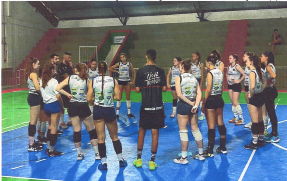
Considerações finais usuais a todos os treinos executados.