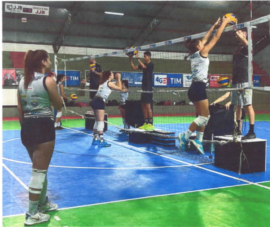
Levantadora executando a passada e ajuste de mãos no Bloqueio (2).

Treino de movimentação de bloqueio, ajustando passada e as mãos conforme mostra na foto, fizemos 20 repetições para cada lado, com passada cruzada e lateral.