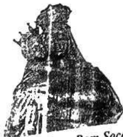
Santuário N. Sra. Bom Socorro

Nova Trento "Capital Catarinense do Turismo Religioso"