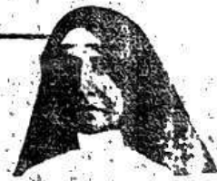
Santuário Madre Paulina

Nova Trento "Capital Catarinense do Turismo Religioso"