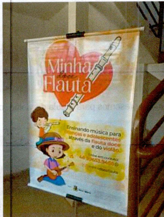
Banner na entrada de acesso (próximo as escadas)