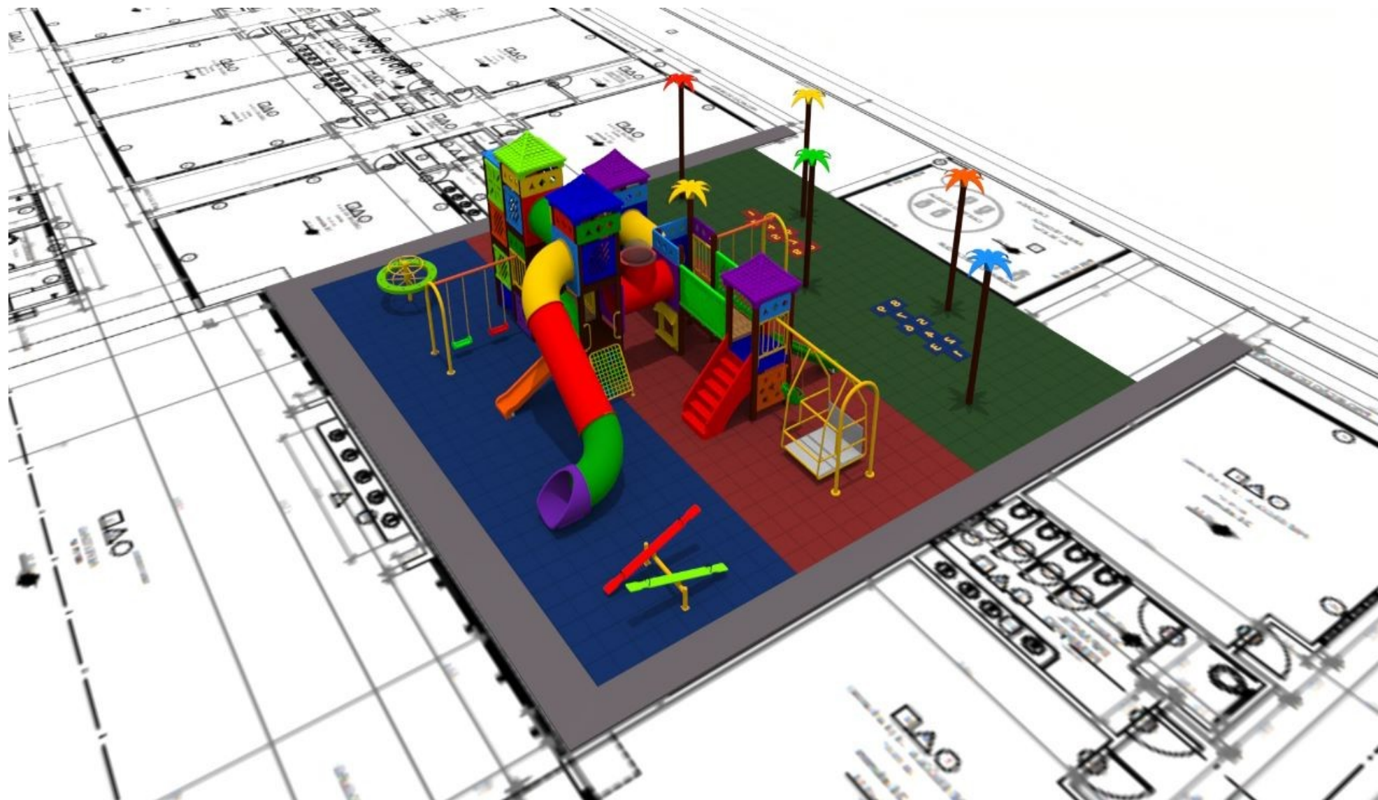
Figura 2: ITEM 02