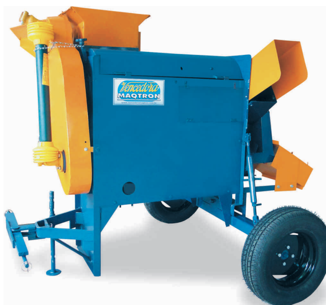
B 340 COMPACTA COM RODADO

Acionada pela tomada de força e transportada pelo 3º ponto do trator.