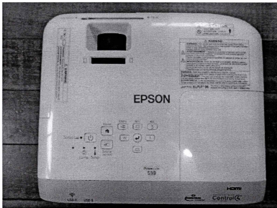
-Projeter: PROJETER EPSON POWERLITE S39 MODELO H854A - S39X52M9427461 / PAT:08644