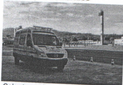
Coberturas de eventos.