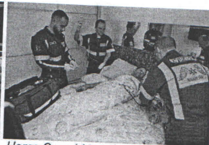
Home Care / Atenção domiciliar.