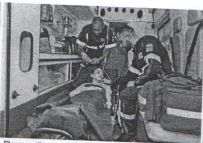
Remoção ou atendimento domiciliar.