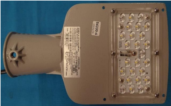
Foto 2 - Vista inferior da amostra.