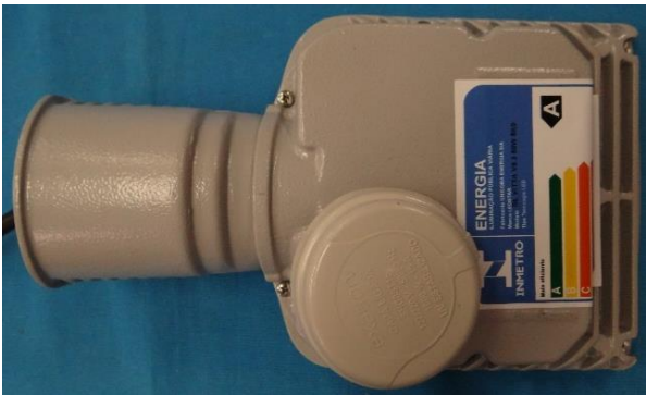
Foto 1 - Vista superior da amostra

Período de realização dos ensaios: 01/04/2020 até 02/06/2020 Data de emissão do relatório: 23/10/2020 Data de emissão do suplemento: 17/11/2020