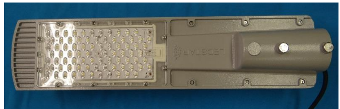
Foto 2 - Vista inferior da amostra.