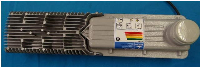
Foto 1 - Vista superior da amostra