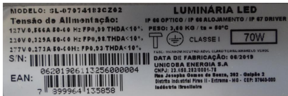
Foto 3 - Etiqueta da amostra