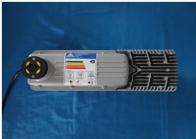
Foto 1 - Vista superior da amostra.