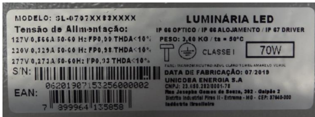
Foto 3 - Placa de identificação da amostra.