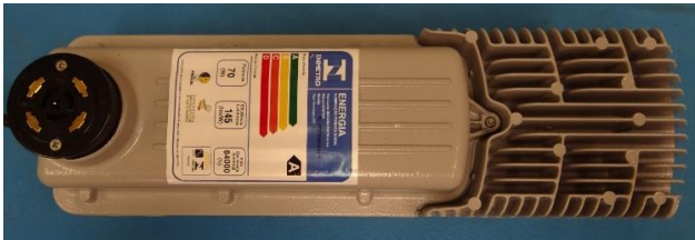
Foto 1 - Vista superior da amostra