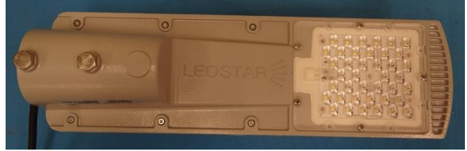
Foto 2 - Vista inferior da amostra.