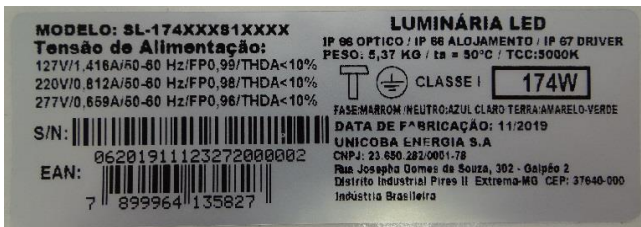
Foto 3 - Placa de identificação da amostra.