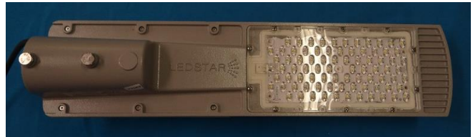
Foto 2 - Vista inferior da amostra.