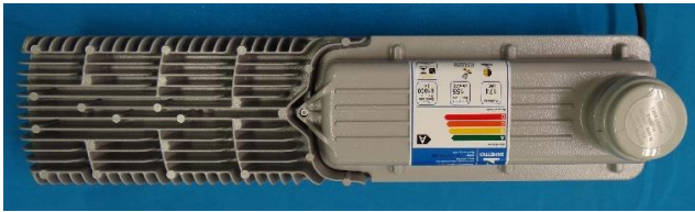
Foto 1 - Vista superior da amostra