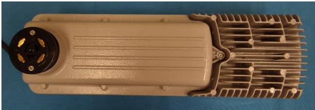
Foto 1 - Vista superior da amostra