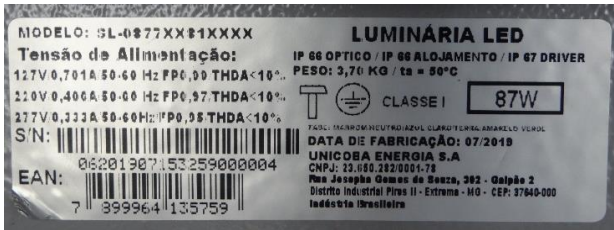
Foto 3 - Placa de identificação da amostra.