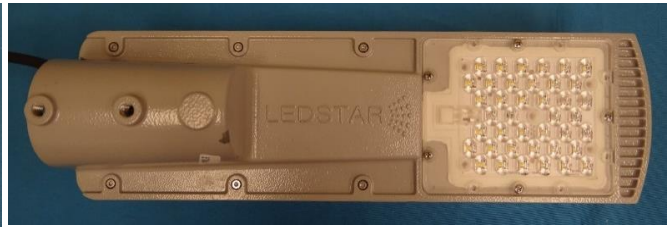
Foto 2 - Vista inferior da amostra.